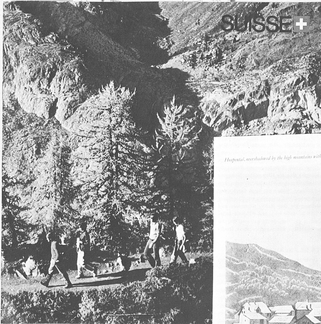
Hospital, overshadowed by the high mountains with their snow-covered peaks, by Peter Birmann