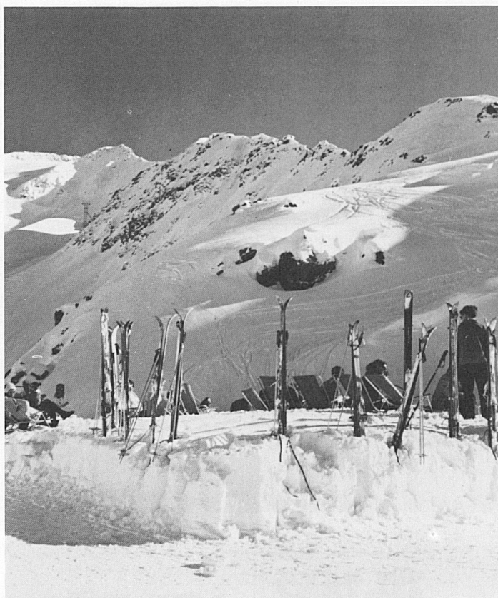
Gurschenalp ab Andermatt/Zentralschweiz

Décembre: 13/15, 19/20. CCN: «Le Rapport dont vous êtes l'Objet», de De Vaclav Havel 15/16. Collégiale: Société chorale, Orchestre de chambre de Waiblingen, Stuttgart. Direction: François Pantillon. Solistes 28/29. CCN: Récitals Monique Rossé 30/31. Théâtre: Compagnie de Scaramouche Expositions Déc./31 janv. 1974. Musée d'histoire naturelle: Louis Agassiz Décembre: Jusqu'au 16. Galerie des Amis des Arts: Ugo Crivelli