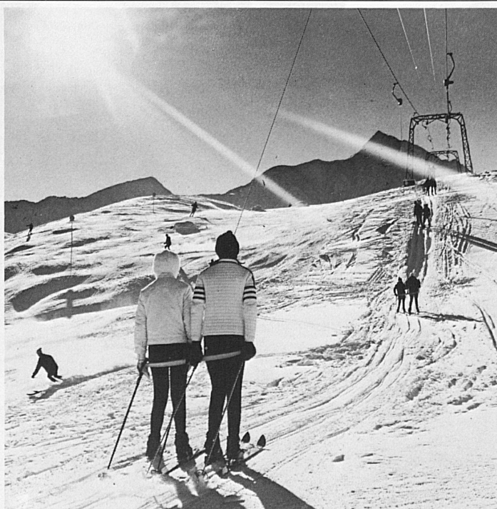
Splügen: Skilift Danaz mit Piz Tambo

Verlangen Sie Spezialprospekt beim Kur- und Verkehrsverein 7250 Klosters Telefon 083 418 77/78 oder Klosters Dorf 083 419 78