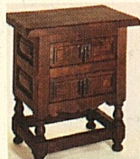
Kredenzil, 55x38 cm nur 148.—