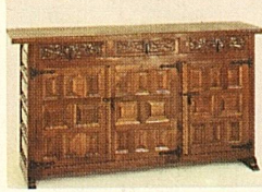
Buffet, 150x80x 45 cm, anderswo 804.—, bei uns nur 598.—