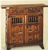
Schränkli, 90x80x 40 cm nur 348.—