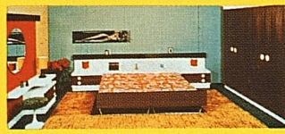
Apertes Doppel-Schlafzimmer mit ex- klusiver Toilette, indirekter Beleuch- tung, Listenpreis Fr. 3880.—, wie Bild, bei uns gratis geliefert nur Fr.