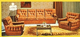
Hochwertige Molteni-Leder-Garnitur, Sofa 4plätzig und 2 Rollen-Clubessel, anderswo Fr. 3850.—, wie Bild, bei uns gratis geliefert nur Fr.