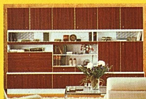
Moderne Luxus-Wohnwand, 300 cm, mit Bar, TV-Abteil, Stereo-Blenden, Besteckschubladen usw. Anderswo Fr. 2400.—, bei uns gratis gel. Fr.

...bei Möbel-Märki - viel günstiger als anderswo!