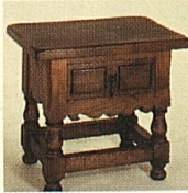
Kredenzil, 55x35 cm nur 98.—