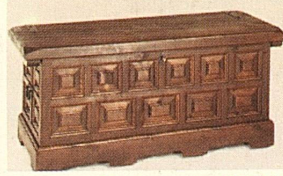
Truhe, 90x50x40 cm bei uns nur 298.—