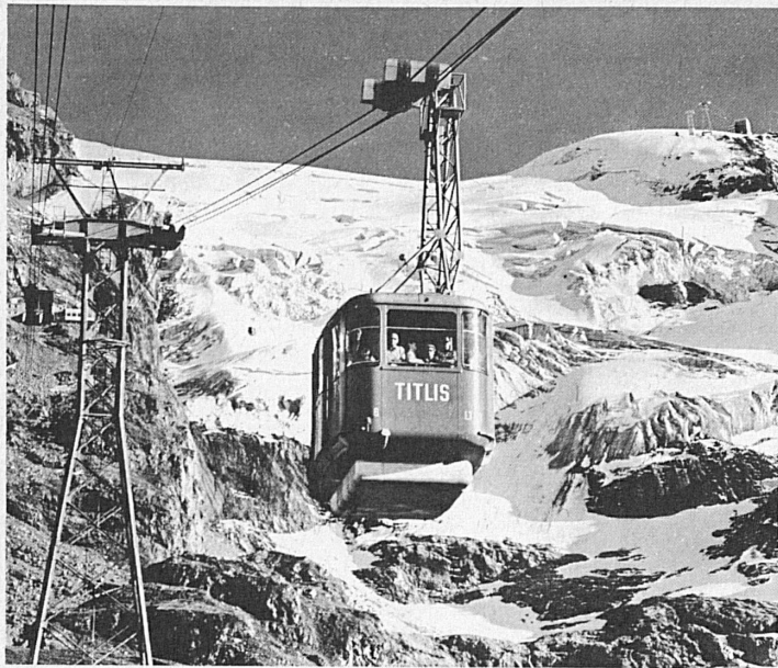
Bergbahnen Téléfériques Aerial cableways Engelberg–Trübsee–Stand–Titlis