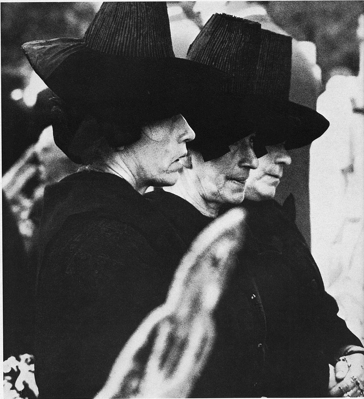
Bergbäuerinnen aus dem Unterwallis und ein Bild mit Anniviarden, Bauern aus dem Val d'Anniviers, dem Eifisehtal, die ihre Rebberge oberhalb Siders im Rhonetal bearbeiten. Zur Arbeit spielt nach altem Brauch eine Gruppe von Trommlern und Pfeifern