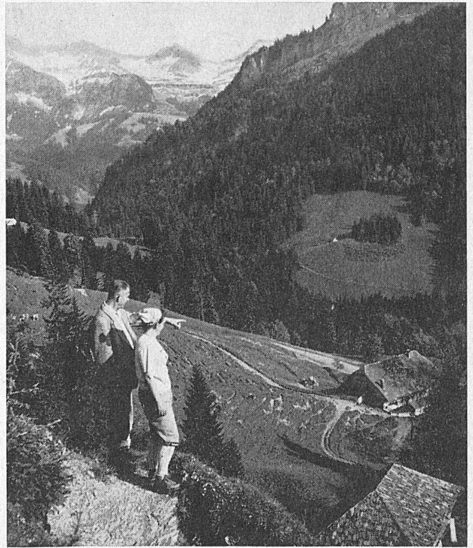
AUF SCHUSTERS RAPPEN DURCHS EMMENTAL

Wir empfehlen die Gasthöfe Bahnhof, Emmenbrücke, Krone Gold- bach, Ochsen, Rest. Waldhaus