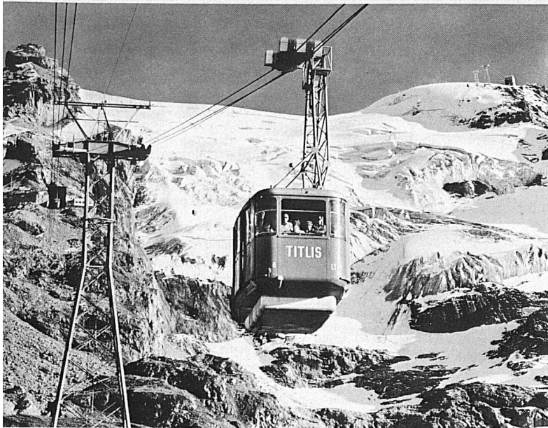
Bergbahnen Télésiéríques Aerial cableways Engelberg-Trübsee-Stand-Titlis