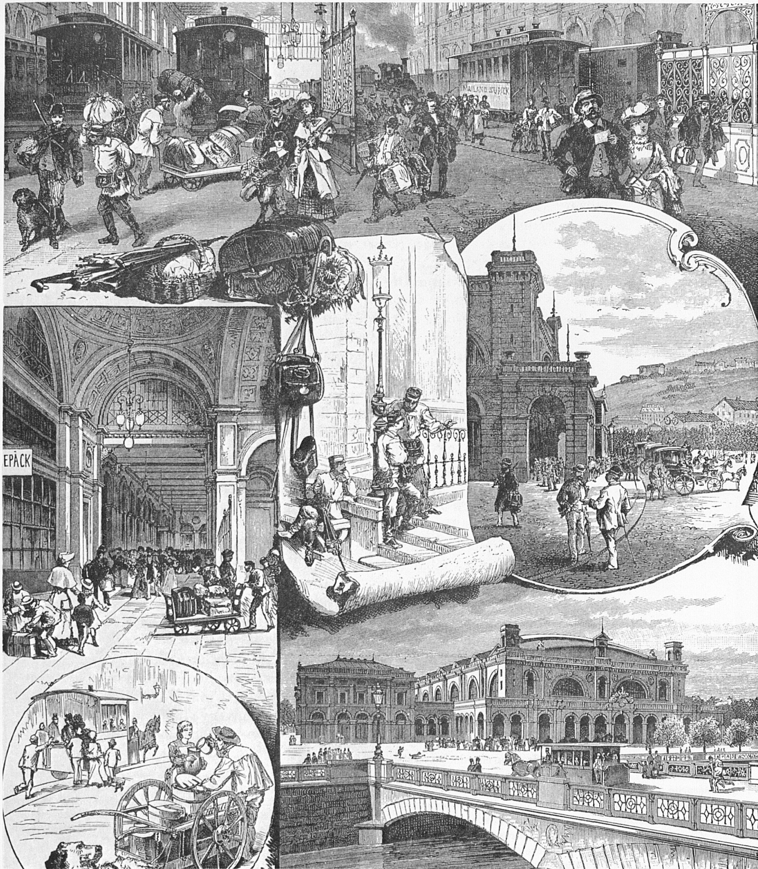
Zürichs Hauptbahnhof kurz nach der Eröffnung der Gotthardbahn 1882 La gare de Zurich au lendemain de l'ouverture de la ligne du Saint-Gothard 1882