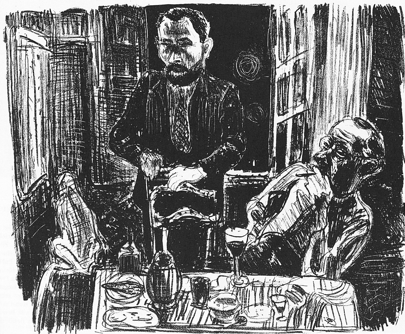
Fritz Pauli, 1927: Les amis, lithographie

ISSUED BY THE SWISS NATIONAL TOURIST OFFICE · 8023 ZÜRICH, TALACKER 42