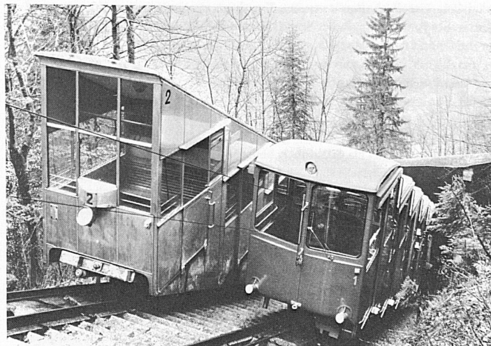
Neue und alte Standseilbahnkabine der Stoosbahn. Abschluss der Totalerneuerung Sommer 1970.

Die fortwährende Erneuerung ist für einen Kurort von grösster Bedeutung.