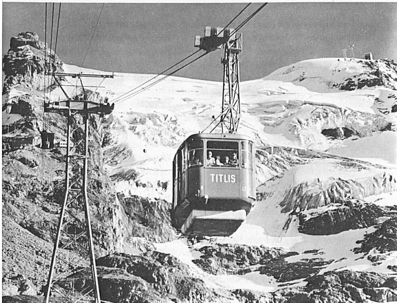
Bergbahnen Téléfériques Aerial cableways Engelberg–Trübsee–Stand–Titlis