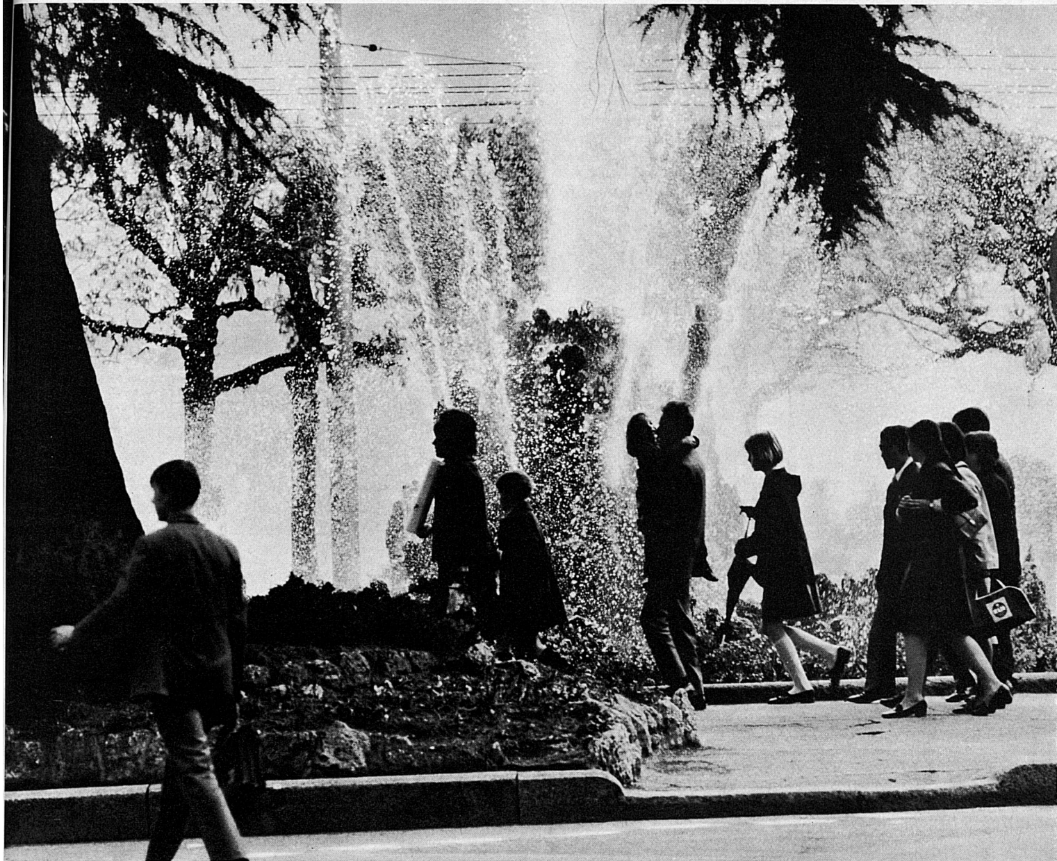
Sommerliches Flanieren vor Wasserspielen in Lugano. Flânerie sur les quais de Lugano Forestieri sul lungolago di Lugano, d'estate Strolling about Lugano near the water fountains

◀ Ferien im Camping, ein Bild aus Locarno. Über unsere Campingplätze orientiert der von der Schweizerischen Verkehrszentrale herausgegebene Prospekt «Camping-Ferien in der Schweiz».