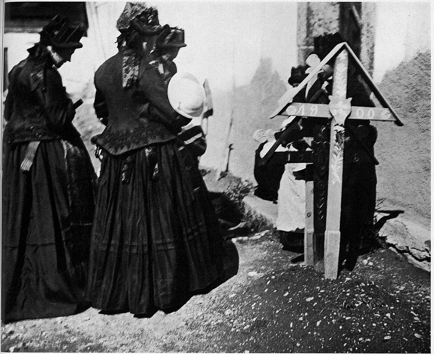
Lötschentalerinnen in der Festtagstracht auf dem Friedhof. Au cimetière. Femmes du Lötschental en costume de fête Donne del Lötschental, in costume festivo, al cimitero Women from Lötschental in their festive costume at the cemetery