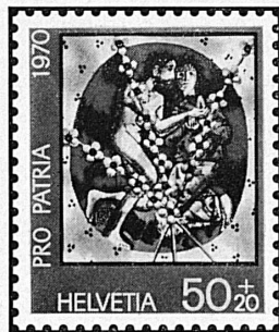
Glasgemälde zeitgenössischer Künstler