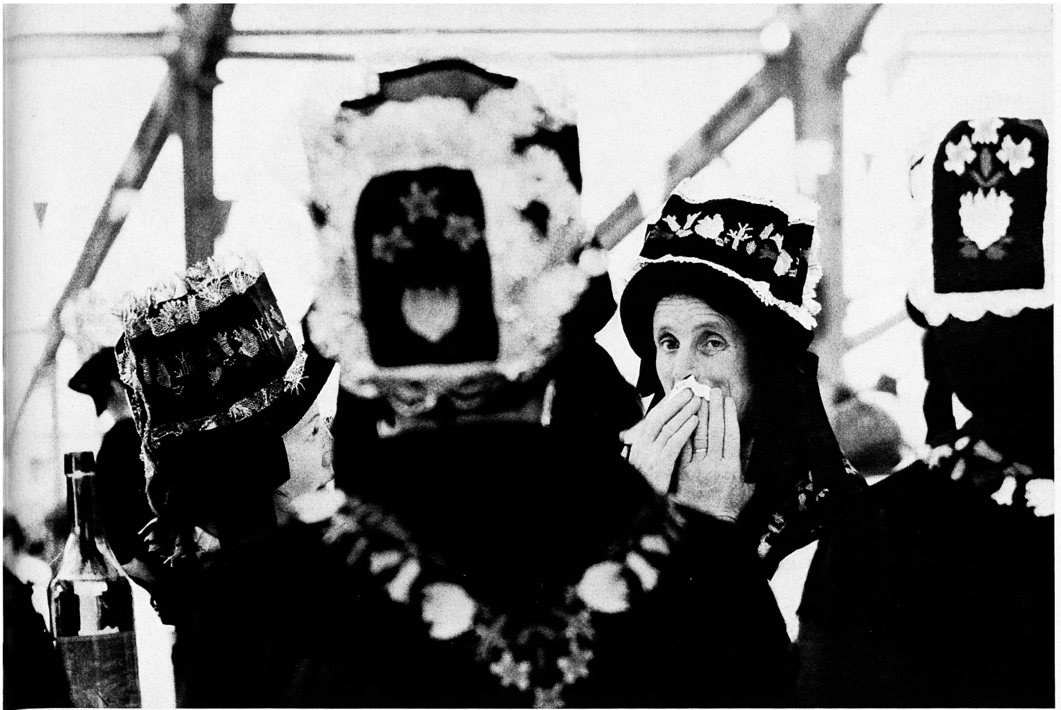
Links: Zwei Bilder aus dem Messeleben der OLMA. (Photos: Comet). Oben: An der OLMA 1969 ist das Wallis zu Gast (Photo Kirchgraber) A gauche: Deux images de l'Olma, la grande foire agricole suisse. En haut: Cette année, le Valais est l'hôte de l'Olma A sinistra: Due immagini dell'Olma. In alto: all'Olma di quest'anno è ospite anche il Vallese Left: Two glimpses of the Olma, St.Gall's agricultural fair. Top: The Valais is the guest canton at the 1969 Olma