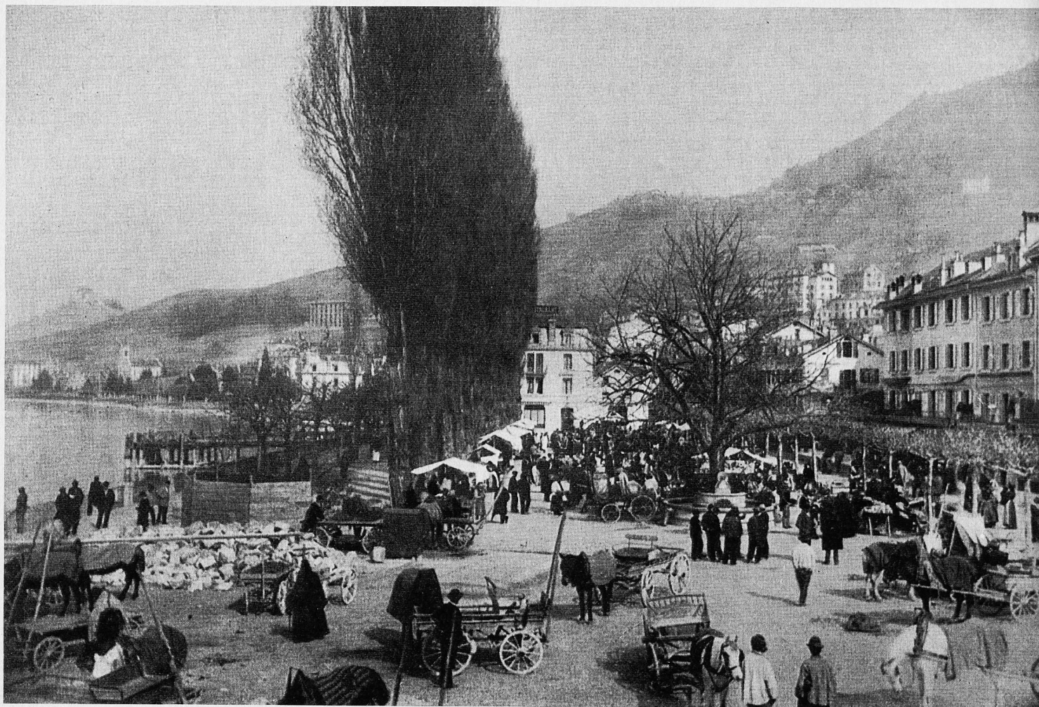
Markttag in Montreux vor dem Jahr 1890

At one time it was the Narcissus Festival, an event that was highly typical of the turn of the century, that made Montreux an artistic centre, thanks to Jaques-Daleroze, among others. Nowadays it is a wide range of events appealing to present-day interests that, from spring into autumn, constitute the cultural highlights of this smart Lake Geneva resort: from the "Golden Rose" Television event in the spring to the brilliant "Septembre musical".