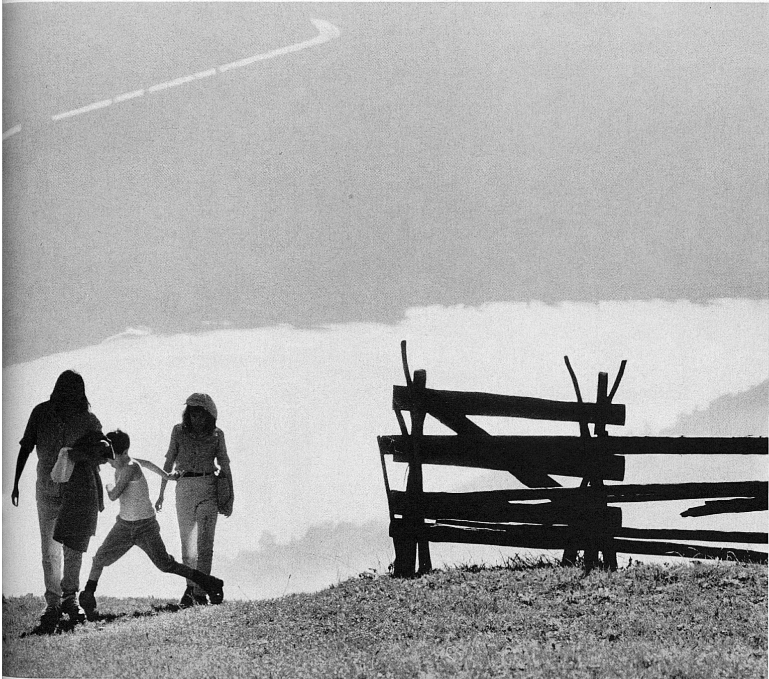
Zwei Bilder aus südlichen Talhängen. 1. Im Gestein der Verzasca, Tessin. 2. Am San-Bernardino-Pass, Graubünden.