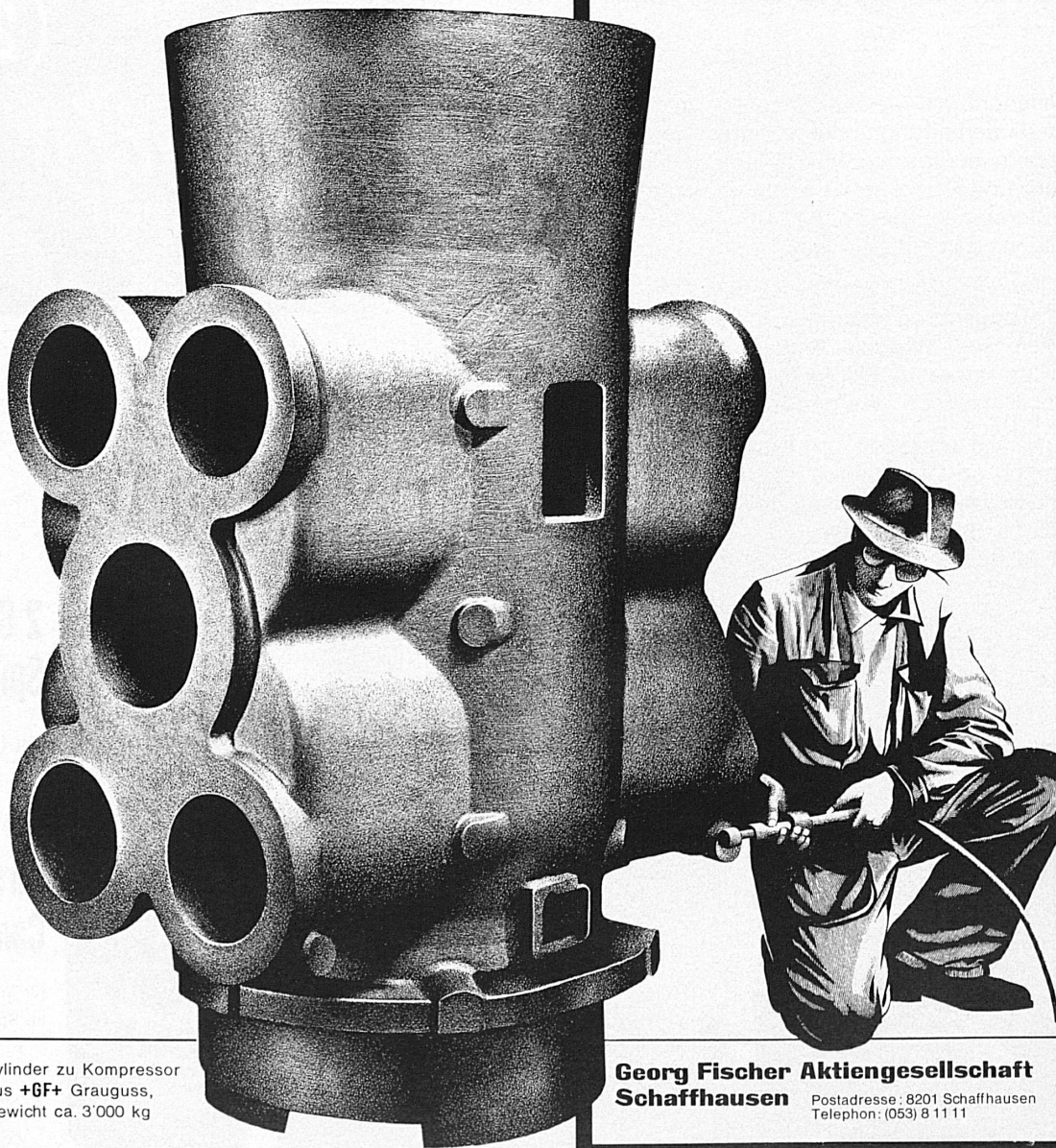
Zylinder zu Kompressor aus +GF+ Grauguss, Gewicht ca. 3'000 kg

Für jeden Bedarf den richtigen gegossenen Werkstoff