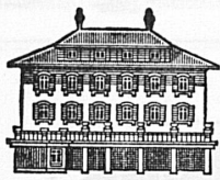
LANDSCHULHEIM OBERRIED BELP BEI BERN

von 11 bis 16 Jahren. Sekundarschule in 5 Kleinklassen. Vorbereitung auf Berufslehre, Handelsschule und Mittelschule. Gründlicher Unterricht, täglich überwachte Aufgabenstunden. Sport. Freizeitwerkstatt.