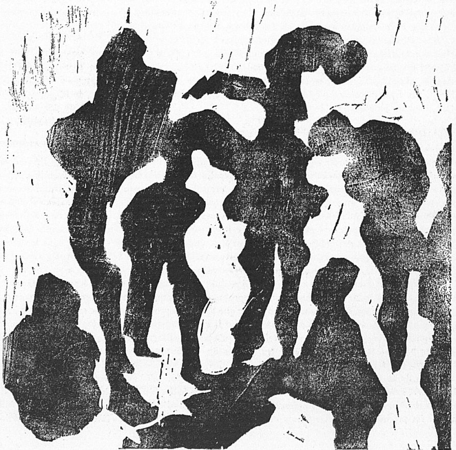
Auf dem Eis / Sur la glace Holzschnitt / Bois: Eugen Bachmann