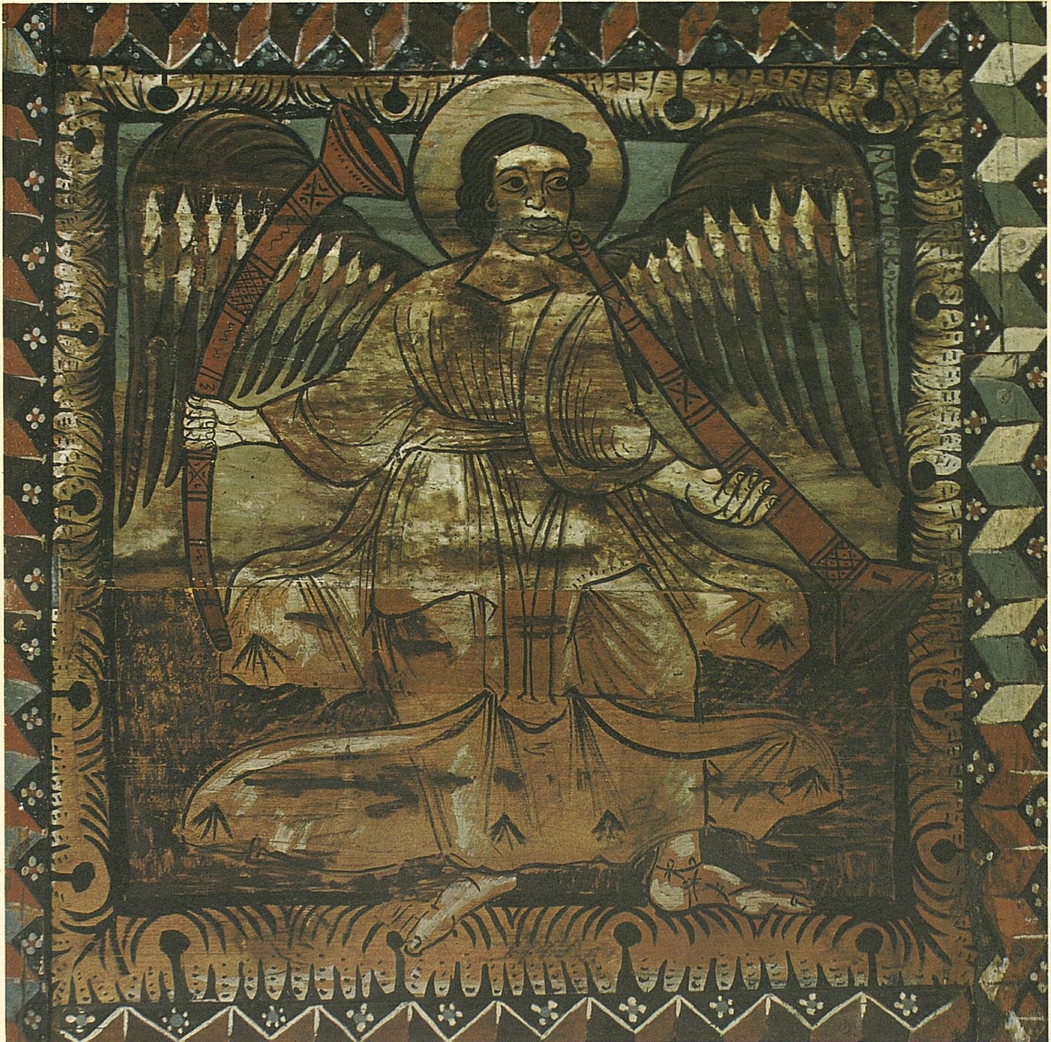
Engel als Südwind. Teilstück der romanischen Kirchendecke in Zillis, Graubünden Ange symbolisant le vent du sud. C'est l'un des 153 caissons du plafond de l'église de Zillis, Grisons