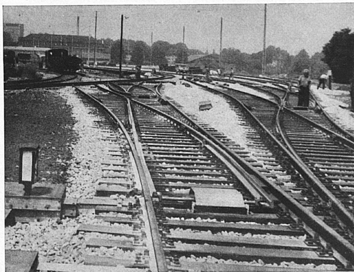
Ausbau Basel GB

Muttenz: Im Gstrüpf 29, Telefon 53 17 25 Filiale Basel, Telefon 33 82 47