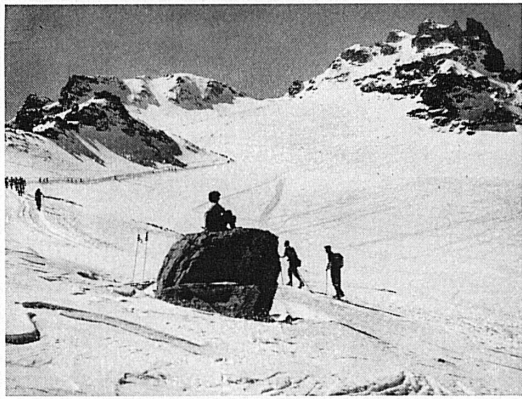
Pizol mit Gletscherabfahrt