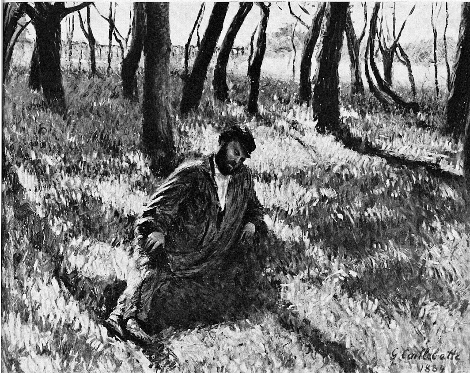
Caillebotte: Claude Monet faisant la sieste, 1884. Aus der bis 19. September dauernden Ausstellung «Peintres de Montmartre et de Montparnasse» im Musée Rath in Genf.

Caillebotte: Claude Monet durante la siesta, 1884. È esposto alla mostra «Pittori di Montmartre e di Montparnasse» aperta al Museo Rath di Ginevra sino al 19 settembre.