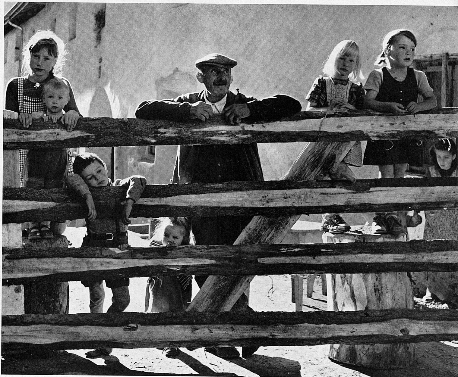
Ardez im Unterengadin erwartet die Heimkehr der Schafherde Ardez (Basse-Engadine): les troupeaux de moutons reviennent de l'alpage Ad Ardez (Bassa Engadina) s'aspetta, d'autunno, il ritorno delle gregge In Ardez, in the Lower Engadine, an autumn day may find young and old awaiting the return of sheep from summer pastures.