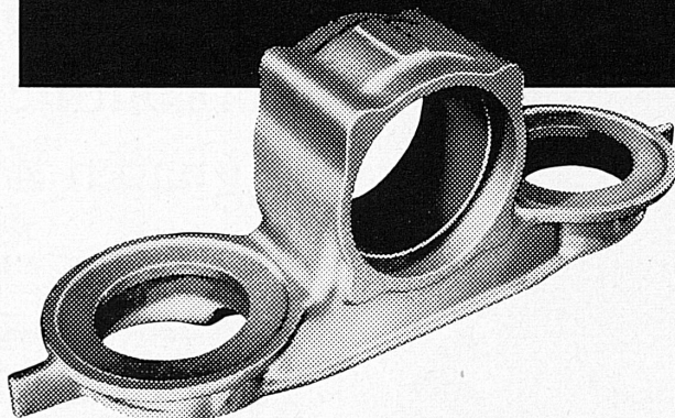
Achsbüchse der SBB-Einheits-Personenwagen Gewicht 44 kg

von Schienenstößen und Weichen werden jährlich durch jede Achsbüchse der SBB-Einheits-Personenwagen aufgefangen. Sicherheit und Fahrkomfort unserer Bahnen hängen zu einem guten Teil von den Achsbüchsen ab: diese bestehen aus +GF+ Stahlguss.