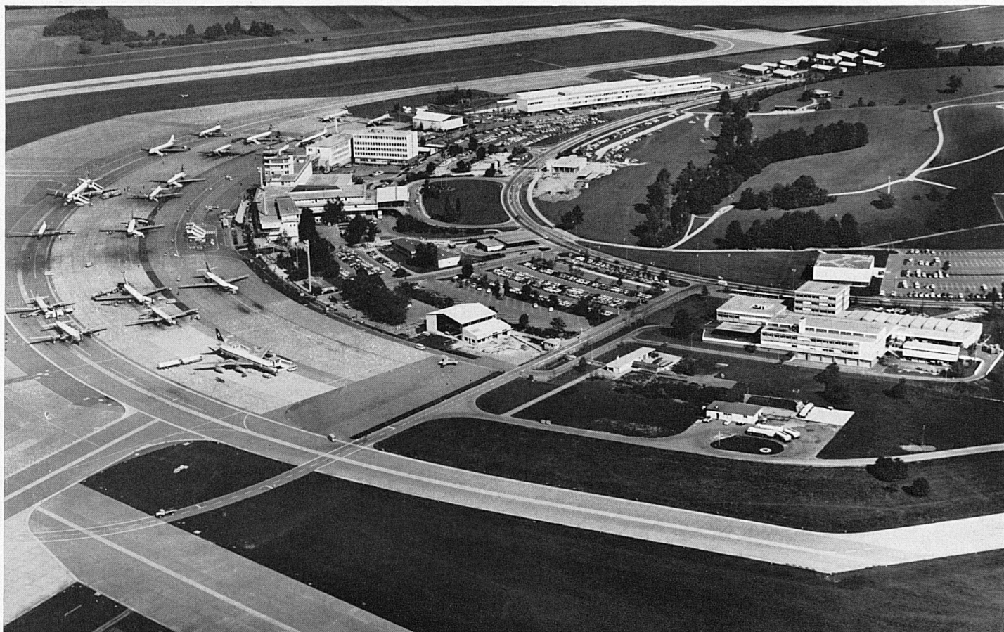
Oben: Flughafenkopf und Flugsteig Links: der Modell-Flughafen