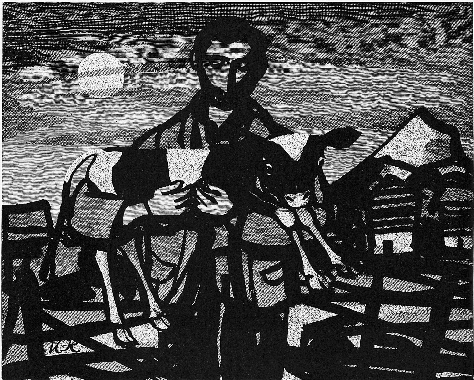
Zeichnung | Dessin: Max Hunziker