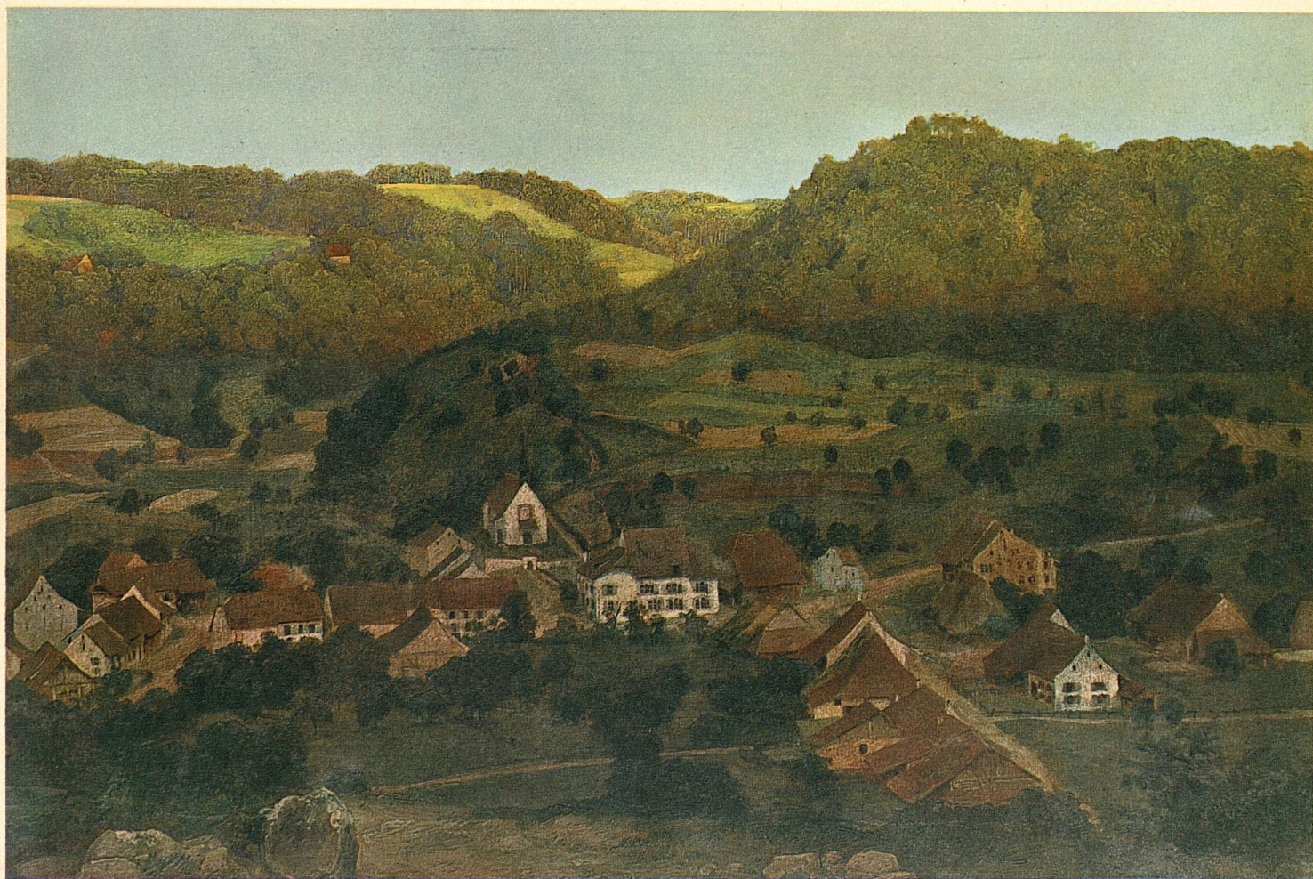
Arnold Böcklin (1827-1901): Tenniken im Kanton Baselland / Tenniken dans le canton de Bâle-Campagne