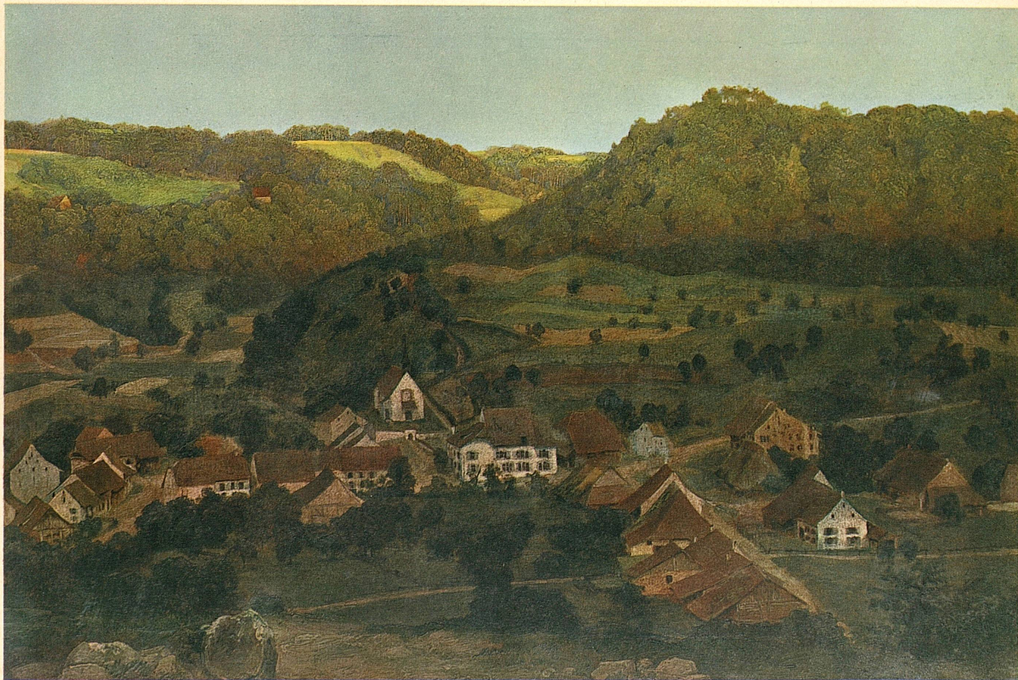
Arnold Böcklin (1827–1901): Tenniken im Kanton Baselland /Tenniken dans le canton de Bâle-Campagne