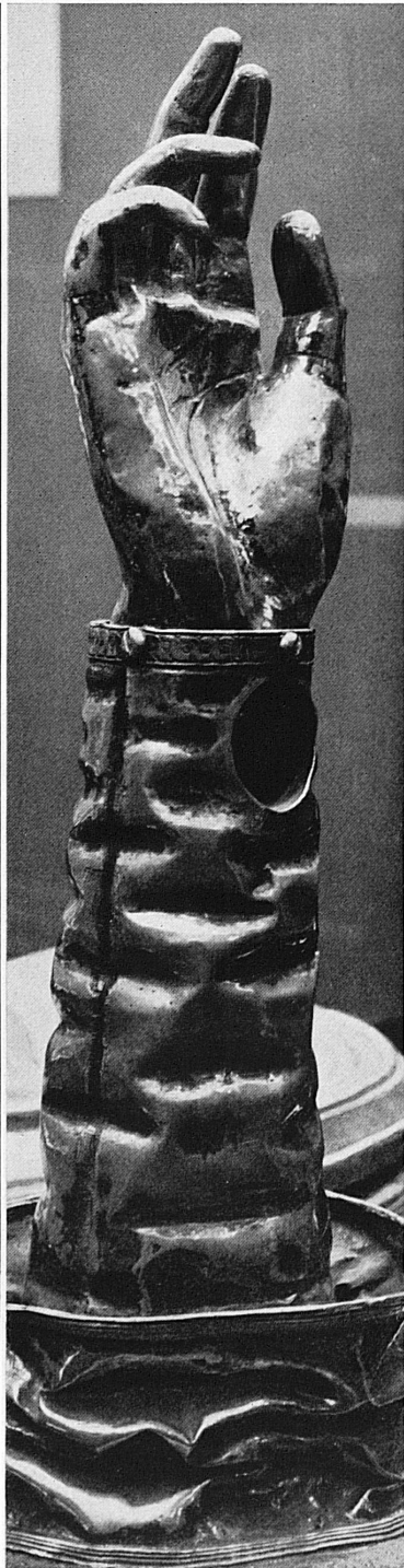
Silbernes Handreliquiar, 16. Jahrhundert. Aus der Sammlung Michel de Bry, Paris.

Hands of a Buddha statue. Lopuri (Siam), 15th century.