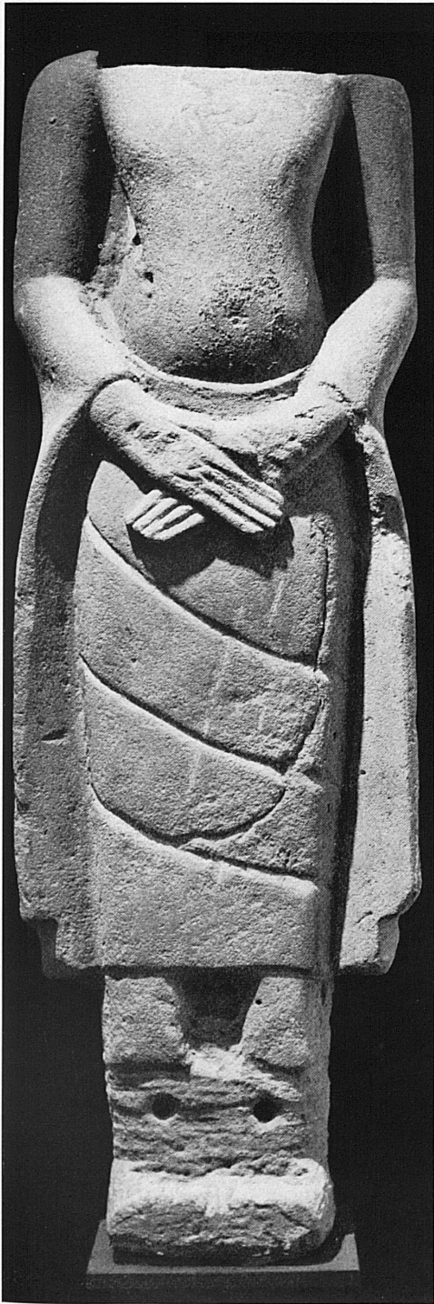
Strenges Formenspiel der Hände eines Buddha-Torsos. Lopuri (Siam), 15. Jahrhundert n. Chr. Rietbergmuseum Zürich.

Les mains de ce Bouddha trouvée à Lopuri (Siam) et datant du XV e siècle de notre ère, composent une figure d'une rigoureuse harmonie. Musée Rietberg, Zurich.