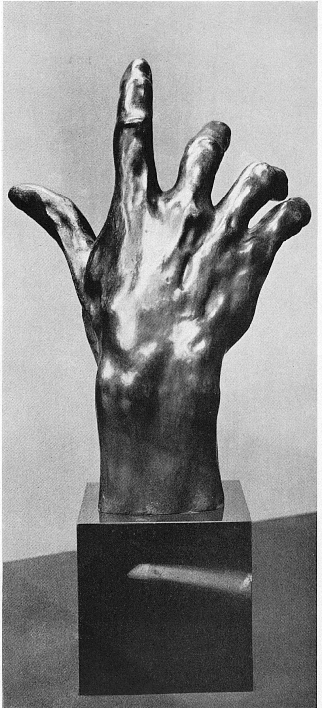
Auguste Rodin, 1840–1917: Handstudie zu den «Bürgern von Calais». Aus dem Musée Rodin, Paris.

Silver hand reliquary, 16th century. From the Michel de Bry Collection, Paris.