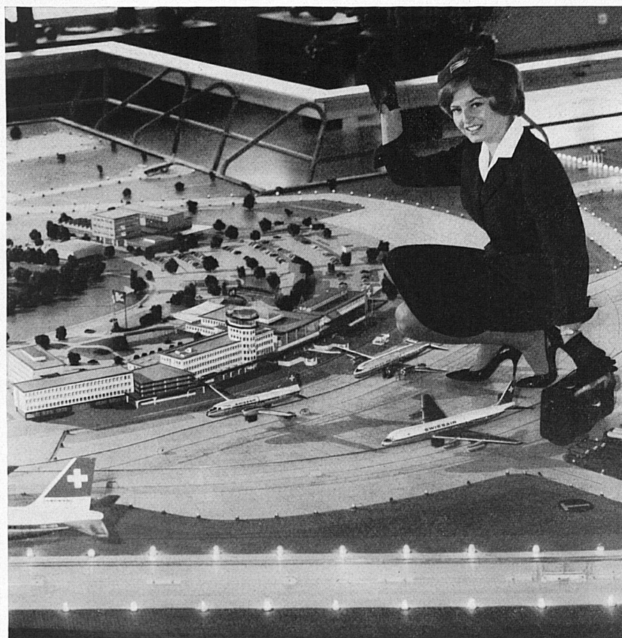
Oben: Flughafenkopf und Flugsteig Links: der Modell-Flughafen