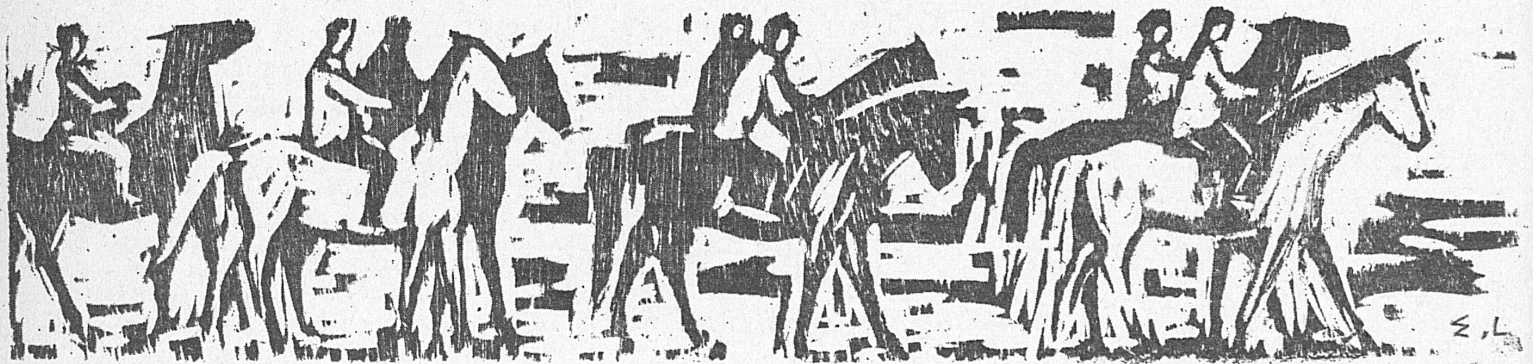
Holzschnitt | Bois: Ernst Leu (zur Ausstellung im Kursaal Heiden, bis 21. August).