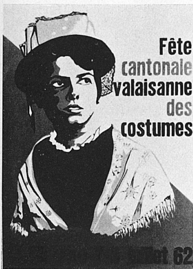
St-Maurice, 7/8 juillet 1962

Das ganze Jahr. Museum Rietberg (Sammlung von der Heydt): Ständige Ausstellung von Werken außer-europäischer Kunst. – Nationalbankgebäude: Trachtenausstellung des Schweizer Heimatwerks. – Schweizer Baumusterzentrale: Permanente Baufachausstellung. – Schweizerisches Landesmuseum. – Zunfthaus zur Meise: Schweizerische Porzellane und Fayencen. – Beim Zoo: Schweizer Alpenbahnmodell.