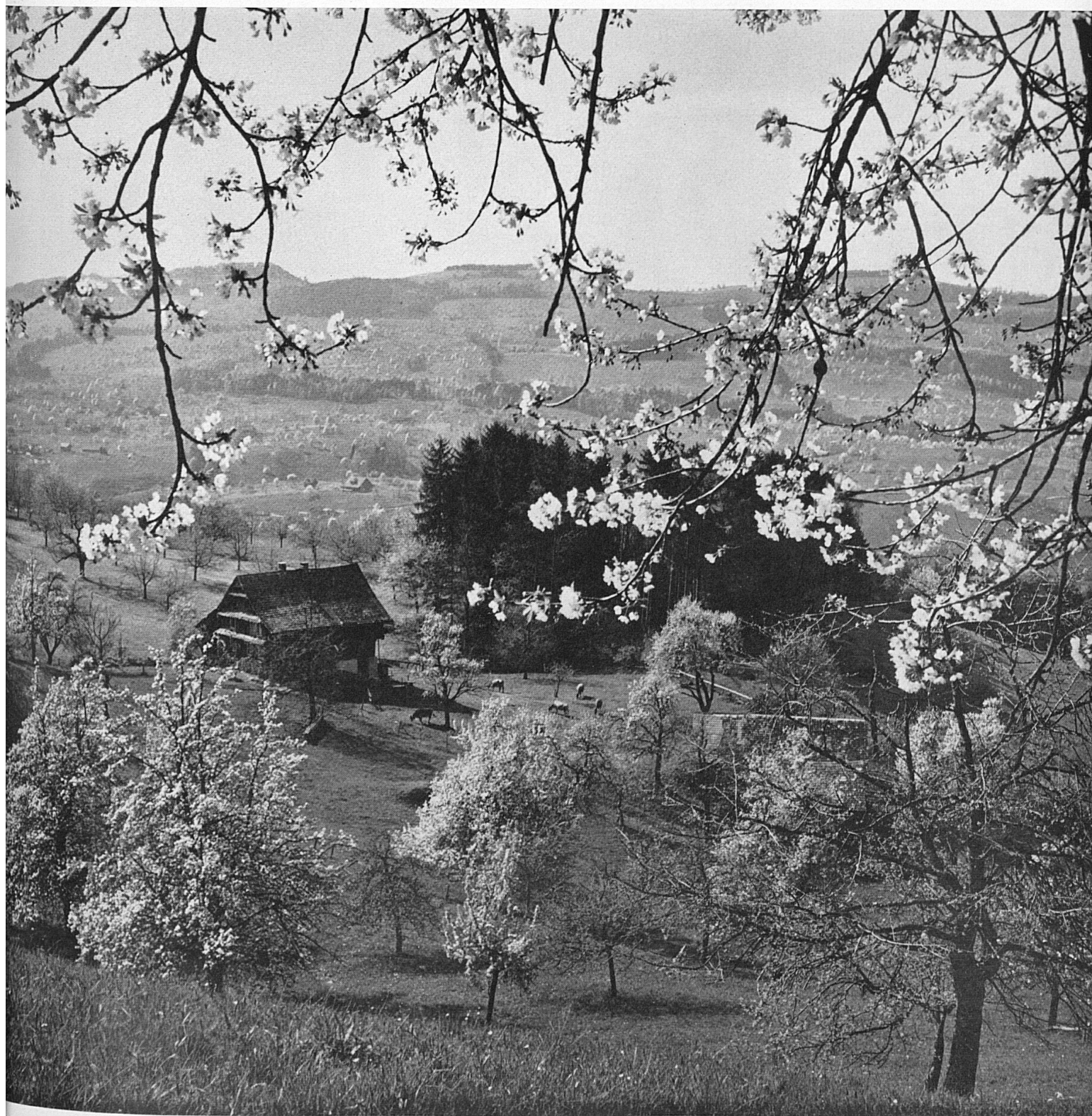
Am Weg zur Seebodenalp ob Küßnacht am Rigi. Sur le chemin de la Seebodenalp, au-dessus de Küßnacht au pied du Rigi. En route to Seebodenalp above Küßnacht at the foot of Mount Rigi.