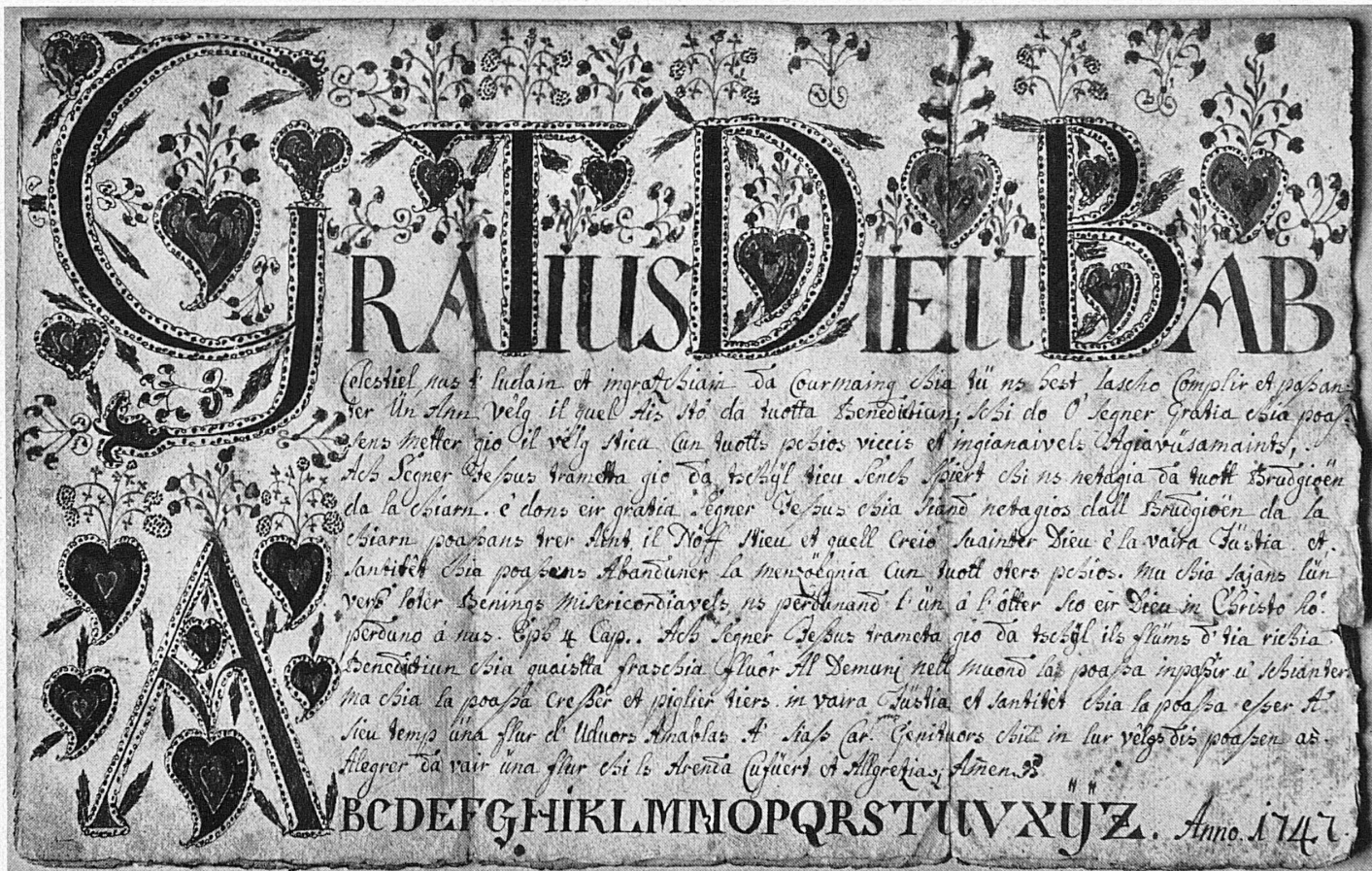
Neujahrswunsch in rätoromanischer Sprache. Bäuerliche Kalligraphie, datiert 1747, heute im Rätischen Museum in Chur.