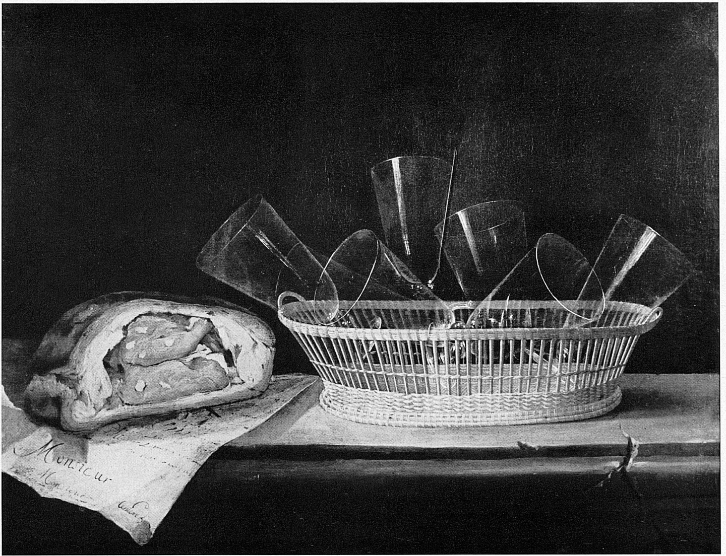
▲ Sebastien Stoskopff (1596–1657): Korb mit Gläsern und Pastete, 49 × 63 cm – Corbeille avec des verres et un pâté, 49 × 63 cm Musée des beaux-arts, Strasbourg