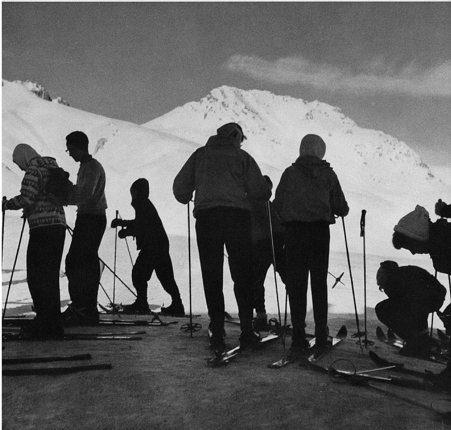
Sosta di sciatori sul Monte Corviglia (2489 m d'altitudine), sopra San Moritz, nei Grigioni Skiers relax on Corviglia (8174 ft.) near St. Moritz, Canton of Grisons