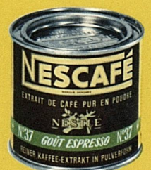
Mit grünem Band: «Goût espresso»