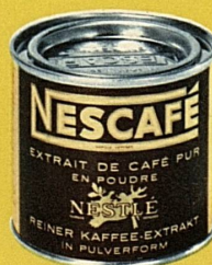
Braune Etikette: Normal

Aus Zentralamerika (Mexiko, Guatemala, Salvador) und aus Südamerika (Kolumbien, Venezuela, Brasilien, über den Hafen Santos) stammen die Kaffeesorten, welche für die Herstellung von Nescafé ausgewählt wurden. Sie verleihen dem Nescafé seinen vollkommenen Geschmack mit dem reichen, unverfälschten Aroma des Bohnenkaffees.