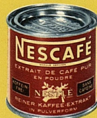
Rote Etikette: Koffeinfrei