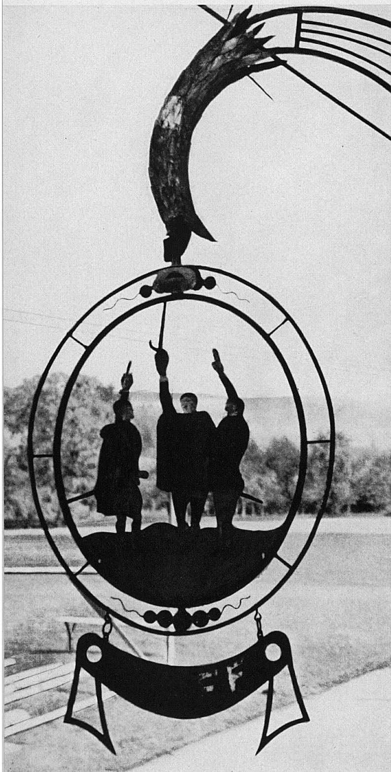
« Die Drei Eidgenossen ». Altes Wirtshauschild in Vucherens bei Moudon « Les Trois Suisses ». Vieille enseigne, à Vucherens sur Moudon « I tre Svizzeri »: antica insegna di locanda a Vucherens presso Moudon "The Three Swiss". Old Inn Sign in Vucherens near Moudon.