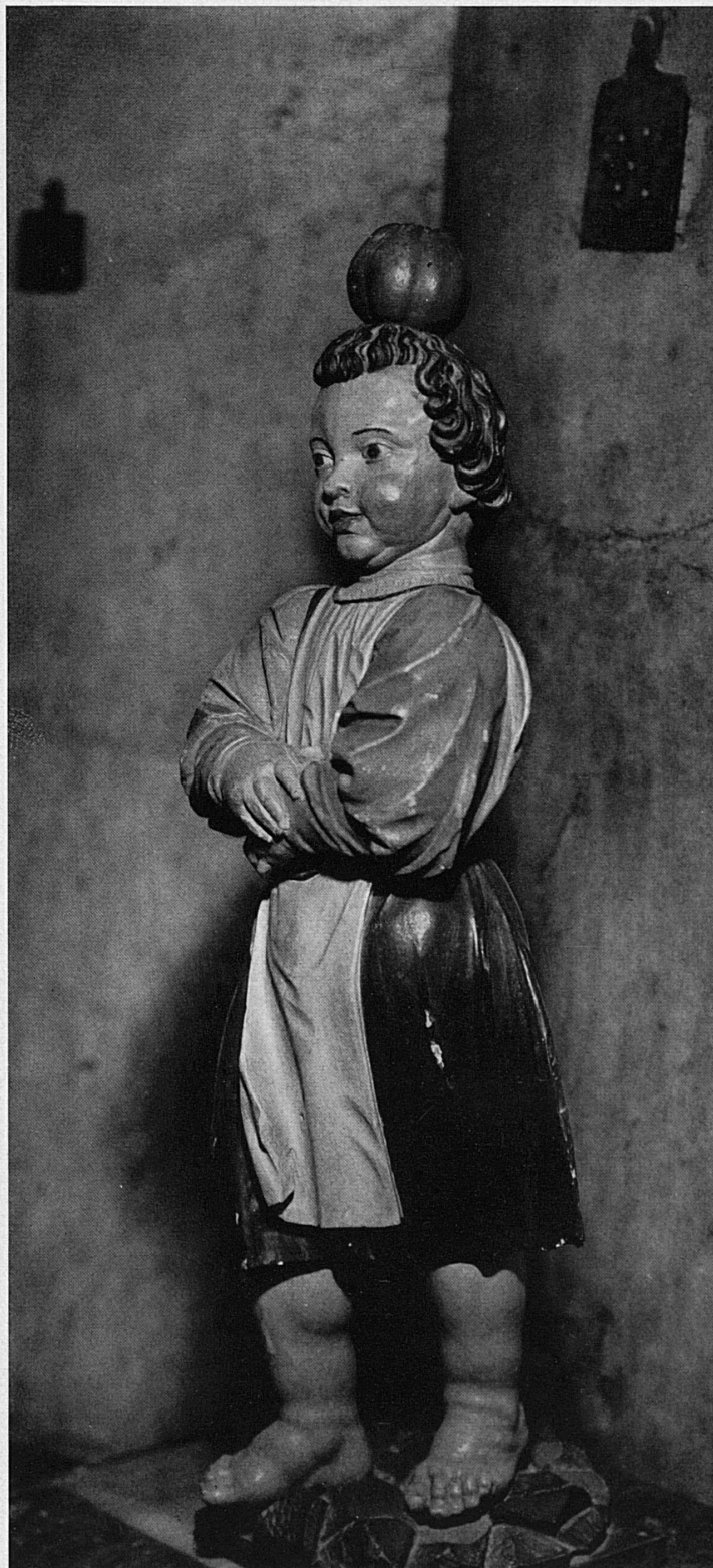
Tellenknabe, 16./17. Jahrhundert, aus dem Berner Zeughaus Historisches Museum Bern. Le fils de Tell, datant des 16/17 es siècles et provenant de l'Arsenal de Berne Musée historique, Berne Il figlio di Tell: scultura del XVI|XVII sec., già all'arsenale di Berna ed ora al Museo storico di quella città William Tell's Son, 16 th /17 th century. From the Berne Arsenal Historical Museum, Berne