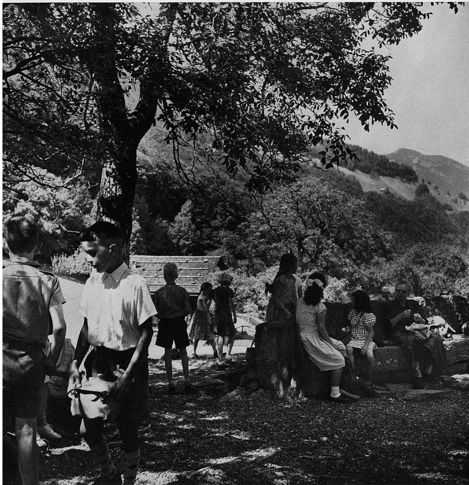
Ein Sommertag auf dem Rütli über dem Vierwaldstättersee, der Wiege der Eidgenossenschaft. Journée d'été sur le Grütli, berceau de la Confédération suisse (Lac des Quatre-Cantons) Giornata estiva sul praticello del Rütli, culla della Confederazione, sovrastante il Lago dei quattro Cantoni A summer day at Rütli Meadow above the Lake of Lucerne, the Cradle of Swiss independence