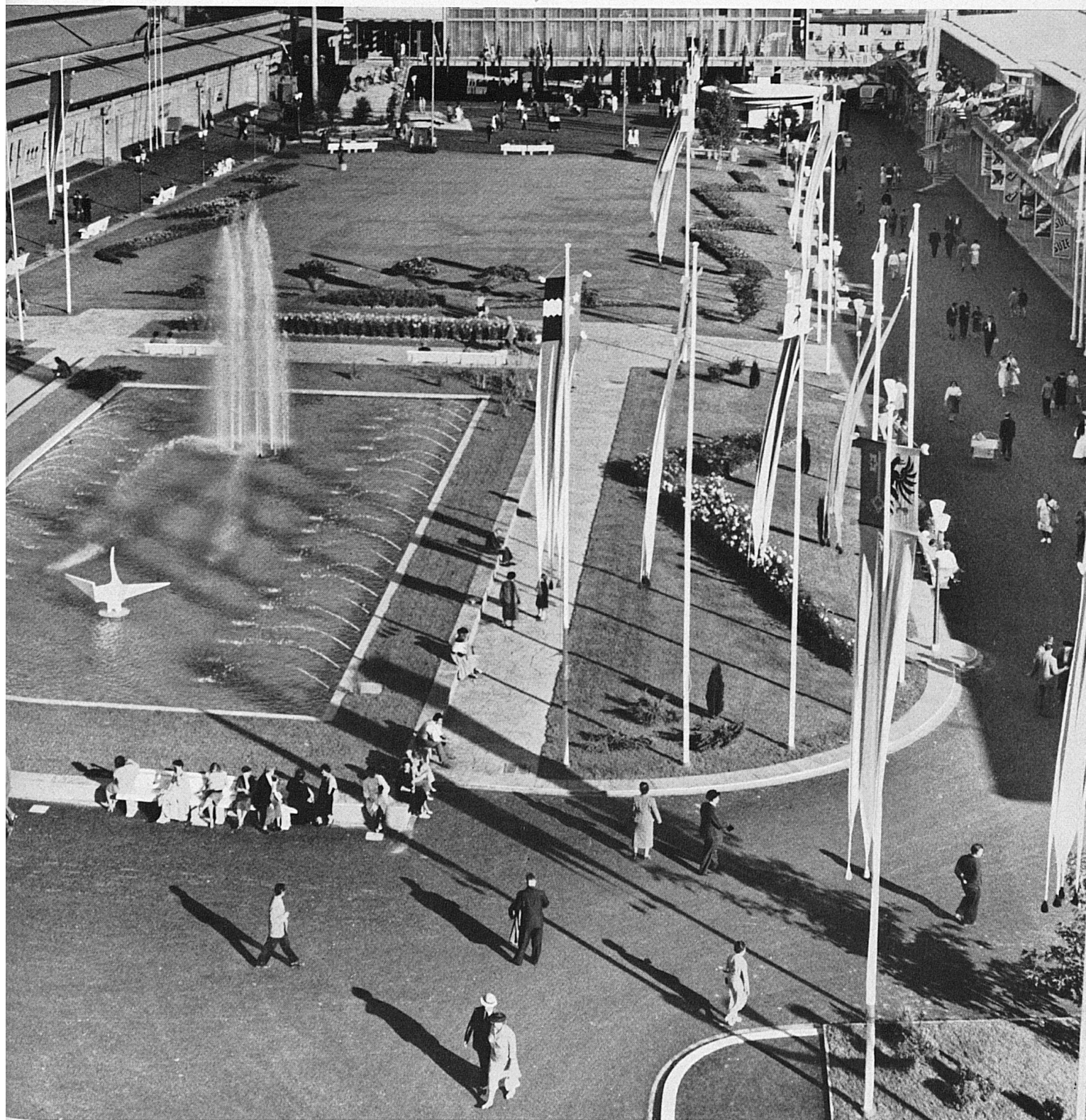
Das festliche Gelände des « Comptoir suisse » in Lausanne.