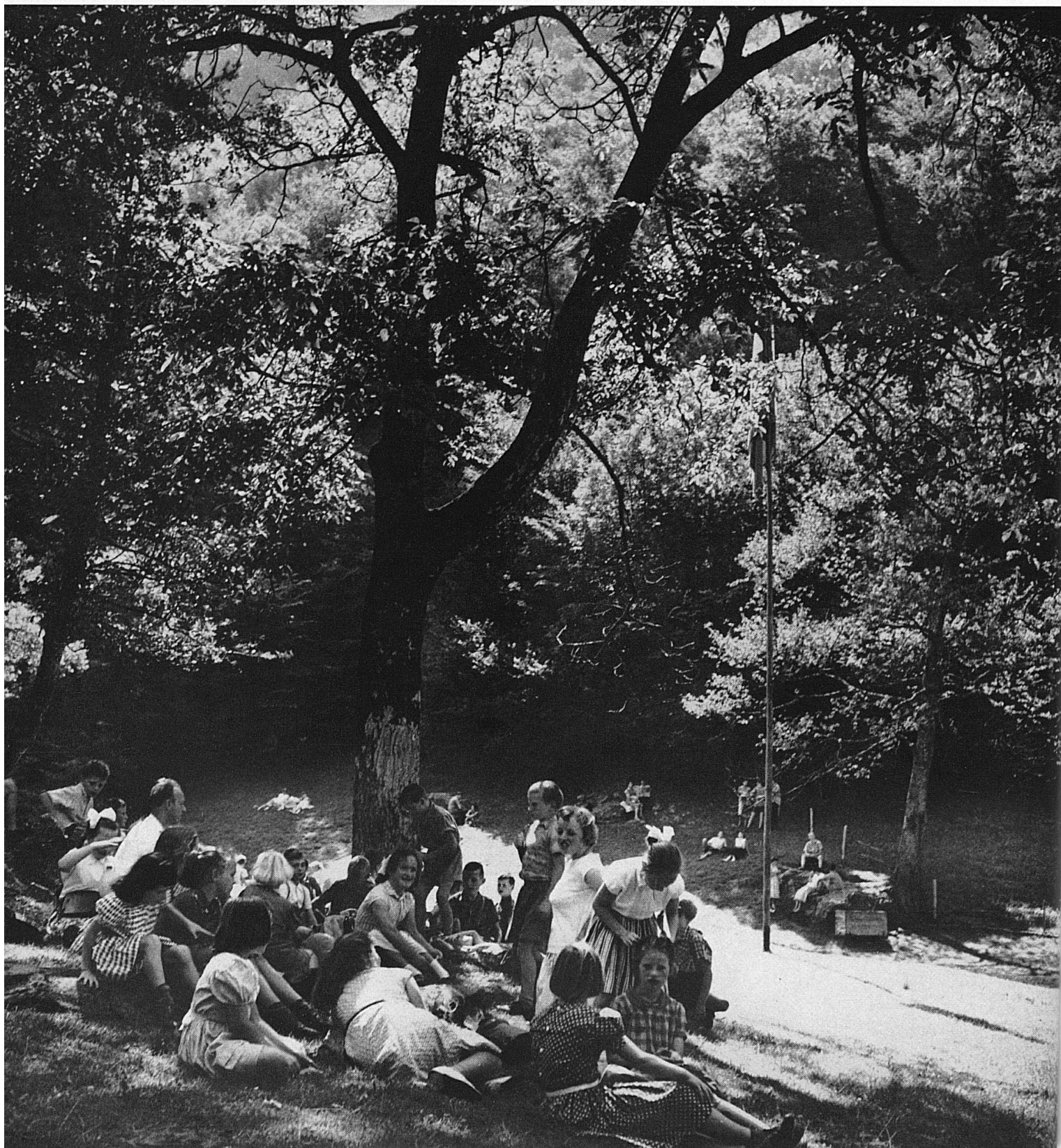
Schulkinder auf der Rütliwiese – Ecoliers sur la prairie du Grütlı – Scolaresche sul prato del Rütli. Escolares suızos en la pradera del Rütli – Swiss schools arrange frequent pilgrimages for their pupils to the Rütli

1860 kam der Kaufvertrag zum Abschluß, der die Rütliwiese zum Gemeingut des Schweizervolkes machte Le contrat de vente qui fait de la prairie du Grütlı une propriété commune du peuple suisse a été conclu en 1860 Nel 1860 fu stipulato il contratto in virtù del quale il praticello del Rütli divenne proprietà del popolo svizzero En 1860 se firmó el contrato de compra por el que la pradera del Rütli pasó a ser bien común del pueblo suızo In 1860 the Rütli meadow was purchased by the Swiss government—as a cultural heritage of all Swiss for all time