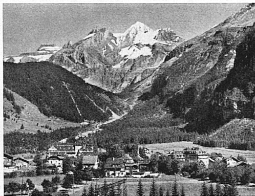
Kandersteg avec Blümlisalp

Les possibilités de promenades et d'excursions sont innombrables. Télésiège au lac d'Oeschinen, bijou des Alpes bernoises. Téléphérique Kandersteg-Stock, idéal pour les excursions. Gorges de Schwarzbach. Tennis, piscine, minigolf. 33 hôtels, 120 chalets, bar, dancing, etc. Syndicat d'initiative.