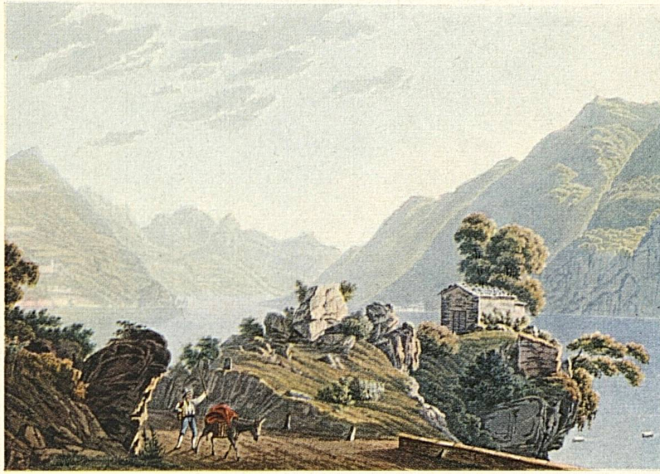
Der Felssporn von San Martino südlich der Bucht von Lugano mit Blick auf den See gegen Porlezza. Koloriertes Aquatintablatt von J.J.Wetzel, 1823. – Heute durchsticht ein Tunnel der Gotthardlinie diesen Felsen.

L'éperon de rocher de San Martino au sud de la baie de Lugano avec vue sur le lac vers Porlezza. Aquatinte de J.-J.Wetzel, 1823. Aujourd'hui, un tunnel de la ligne du Gothard traverse ces rochers.