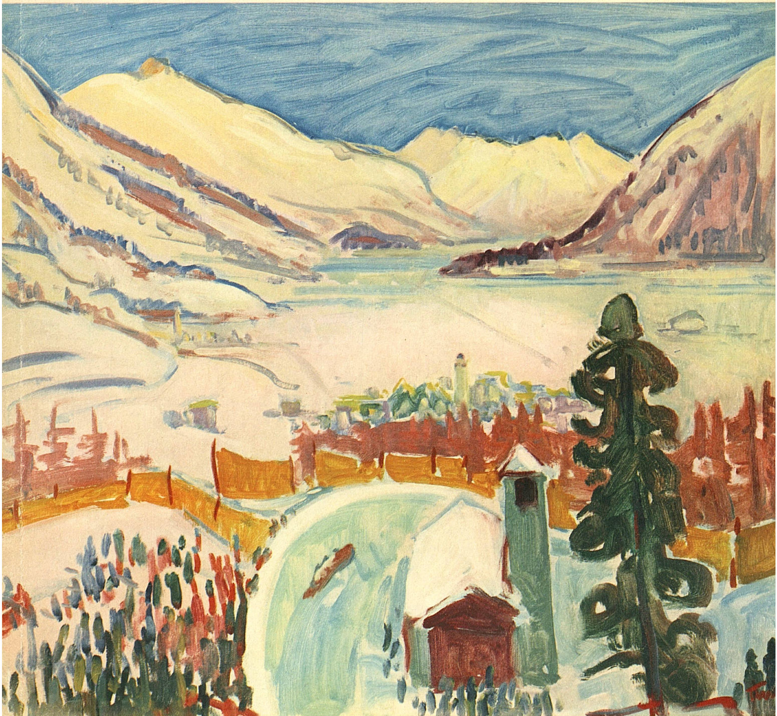
Turo Pedretti: Die Bobbahn von St. Moritz mit Blick auf Celerina – A la piste de bob de St-Moritz

Office National Suisse du Tourisme • Ufficio Nazionale Svizzero del Turismo