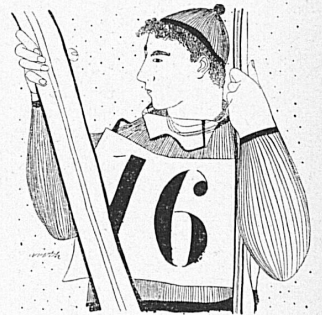
Zeichnung / Dessin: Kurt Wirth

Nous attendons avec impatience les Championnats suisses de ski qui se dérouleront du 1 er au 4 mars sur les magnifiques pentes de Gstaad. Chaque sportif, s'il le peut, s'empresera de coiffer la casquette blanche pour assister personnellement dans la station de l'Oberland bernois à ces importantes compétitions.