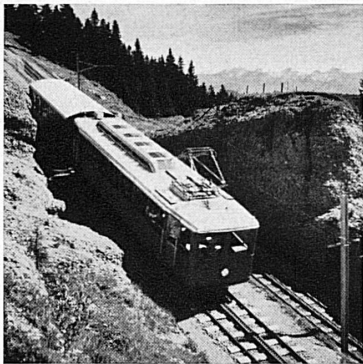
Vitznau-Rigi Kulm