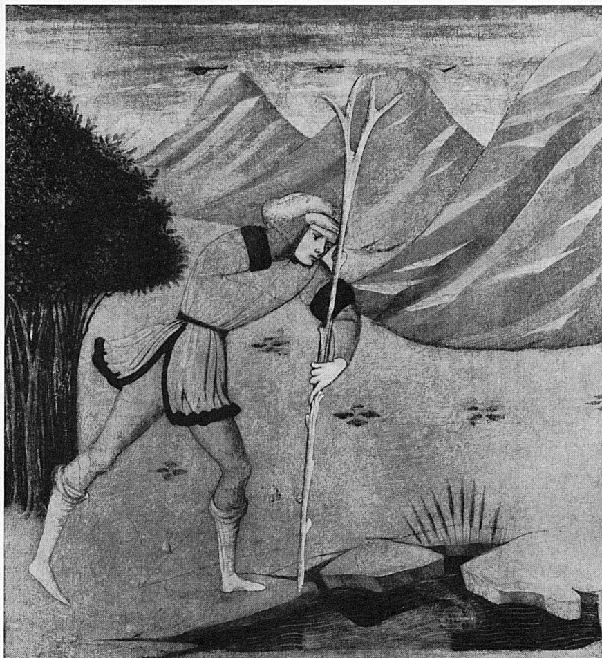
Meister des «Paris-Urteils»: Narziss betrachtet sein Spiegelbild