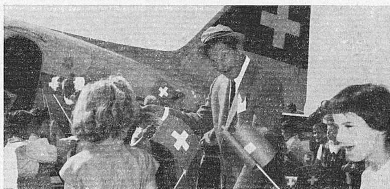
Danny Kaye