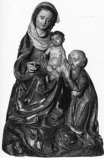
Anbetung der Könige, süddeutsch, 1500