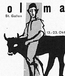
Bahnbillette einfach für retour

Die OLMA in St.Gallen wird wiederum ihre ganze traditionelle Pracht entfalten. Besonders die landwirtschaftlichen Besucherkreise werden es begrüßen, daß St.Gallen dieses Jahr eine Großviehschau mit Tieren der Braunviehrasse zeigt. Den ansehnlichen Bestand stellen Züchter aus den Kantonen Uri, Schwyz, Ob- und Nidwalden. Neben den üblichen großen Abteilungen bringt die OLMA auch wieder eine Schau prächtiger Früchte und goldenen Ackersegen. Die Billette einfach für retour müssen in der Ausstellung abgestempelt werden.