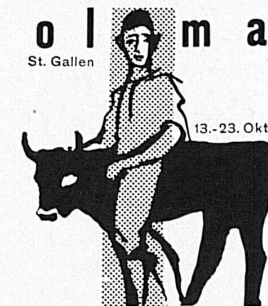
Bahnbillette einfach für retour

Die OLMA in St. Gallen wird wiederum ihre ganze traditionelle Pracht entfalten. Besonders die landwirtschaftlichen Besucherkreise werden es begrüßen, daß St. Gallen dieses Jahr eine Großviehschau mit Tieren der Braunviehrasse zeigt. Den ansehnlichen Bestand stellen Züchter aus den Kantonen Uri, Schwyz, Ob- und Nidwalden. Neben den üblichen großen Abteilungen bringt die OLMA auch wieder eine Schau prächtiger Früchte und goldenen Ackersegens. Die Billette einfach für retour müssen in der Ausstellung abgestempelt werden.