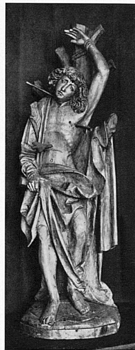
St. Sebastian, Geiler zugeschrieben 1. Viertel 16. Jahrhundert St-Sébastien, attribué à Geiler 1 er quart XVI e siècle

Sept./Okt. Casino-Kursaal: Täglich Konzerte, Dancing, Boulespiel.