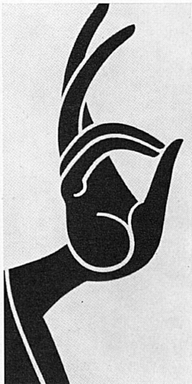
Ikonen und Skulpturen im Kunstmuseum Luzern, bis 9. Oktober

Zürich Sept./Mitte Okt. Unterengstringen: Dahlienschau. Sept./Mai 1956. Spielzeit des Stadttheaters (Opern, Operetten, Gastspiele), des Schauspielhauses und des Rudolf-Bernhard-Theaters. September: Bis 24. Helmhaus: Ausstellung «Theaterbau von der Antike bis zur Moderne». 10./12. Albiggüti: Zürcher Knabenschießen. – Kongreßhaus: Pilzausstellung. 10. Sept./Ende Okt. Kunsthaus: Ausstellung «Die Schönheit des 18. Jahrhunderts» (Gemälde, Skulpturen, Porzellan und Zeichnungen). 11./17. Kongreß des «Institut international de la soudure». 12./17. Cinéma Urban: 5. Amateur-Jazz-Festival. 15. Mormonenkongreß 1955. Mitte Sept. Beginn der Spielzeit des Theaters am Central (Komödien und Lustspiele). 21. Kirche Enge: Orgelkonzert, Detmolder Kantorei und Erich Vollenwyder. 22. Sept./2. Okt. Hallenstadion: «Züsä», Zürcher Herbstschau. 25. Tonhalle: Chorkonzert des Neuen Oratorienchors Zürich. – Staffellauf «Quer durch Zürich». 26. Kongreßhaus: Konzert des Orchesters Helmuth Zacharias. 28. Tonhalle: Chopin-Abend Shura Cherkassky, Klavier. 29. Sept./1. Okt. Zusammenkunft Europ. Präzisionsgüßhersteller. Oktober: 2. Rad: Grand Prix de Suisse (Einzelzeitfahren). – Zürcher Orientierungslauf. – Diätikon: Kunstturnermatch Schweiz-Österreich.