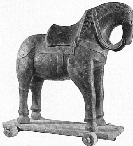
Reitpferdchen für Kinder, Holz bemalt, 17. Jahrhundert Engadiner Museum St. Moritz