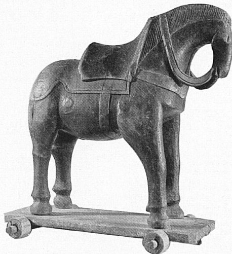
Reitpferdchen für Kinder, Holz bemalt, 17. Jahrhundert Engadiner Museum St. Moritz

Pierre Bonnard ist ein Poet des Lichtes und der Farben. Keiner hat wie dieser schönheitstrunkene Maler die Reize des über Körper, Dinge und Landschaften fließenden Lichtes darzustellen gewußt. Mit seinem malerischen Werk hat er die beste Tradition des französischen Impressionismus zu neuer und genial persönlicher Vollendung geführt. Zu Recht gilt Pierre Bonnard als einer der größten Meister der modernen Malerei. Im Jahre 1947 ist der achtzigjährige Maler in Le Cannet am Ufer seines geliebten Mittelmeeres gestorben. – Die Basler Kunsthalle widmet ihm vom 28. Mai bis zum 17. Juli 1955 eine bedeutende Ausstellung. Sie umfaßt rund neunzig ausgesuchte Gemälde sowie Aquarelle, Zeichnungen und Graphik aus zahlreichen Museen und Privatsammlungen von Frankreich, Belgien, Holland, England, Italien und der Schweiz. Gerade in unserem Lande hat der große Kolorist immer besondere Freunde und Sammler gefunden. rst.