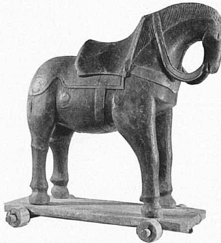
Reitpferdchen für Kinder, Holz bemalt, 17. Jahrhundert Engadiner Museum St. Moritz

Pierre Bonnard ist ein Poet des Lichtes und der Farben. Keiner hat wie dieser schönheitstrunkene Maler die Reize des über Körper, Dinge und Landschaften fließenden Lichtes darzustellen gewußt. Mit seinem malerischen Werk hat er die beste Tradition des französischen Impressionismus zu neuer und genial persönlicher Vollendung geführt. Zu Recht gilt Pierre Bonnard als einer der größten Meister der modernen Malerei. Im Jahre 1947 ist der achtzigjährige Maler in Le Cannet am Ufer seines geliebten Mittelmeeres gestorben. – Die Basler Kunsthalle widmet ihm vom 28. Mai bis zum 17. Juli 1955 eine bedeutende Ausstellung. Sie umfaßt rund neunzig ausgesuchte Gemälde sowie Aquarelle, Zeichnungen und Graphik aus zahlreichen Museen und Privatsammlungen von Frankreich, Belgien, Holland, England, Italien und der Schweiz. Gerade in unserem Lande hat der große Kolorist immer besondere Freunde und Sammler gefunden. rst.