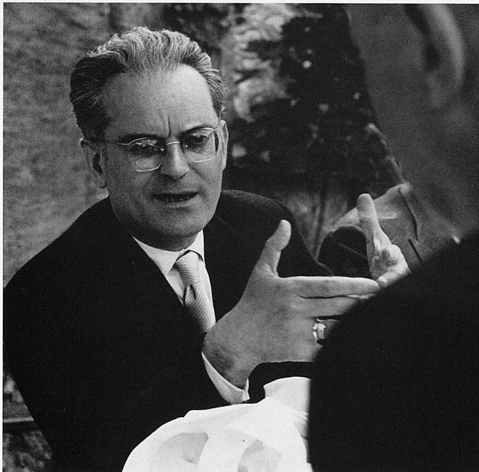
Bundesrat / Conseiller fédéral Dr. Giuseppe Lepori

In der unvergleichlichen Atmosphäre der romantischen Walliser Hauptstadt Sitten bekräftigte Bundesrat Dr. Lepori die Bereitschaft der Landesregierung, die schweizerische Fremdenverkehrswerbung entschlossen zu unterstützen. Im Zeitalter des Welttourismus kann die Schweiz als Reiseland sich im Wettbewerb mit allen andern Ländern nur behaupten, wenn die öffentliche Hand und alle Nutznießer am Fremdenverkehr ihren angemessenen Beitrag an die Werbekosten leisten.