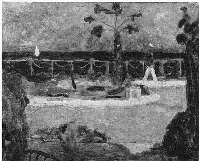
Pierre Bonnard: «Méditerranée» 1955

Juni/Okt. Kursaal: Nachmittags- und Abendkonzerte, Sonderveranstaltungen, Dancing, folkloristische Abende, Boulespiel. – Kunstmuseum: Permanente Ausstellung «Schweizer Kunst, 15. bis 20. Jahrhundert». Juni: Bis 19. Kunsthaus: Ausstellung «Volkskunst Luzern». 12. Nationaler Wettbewerb für Wasser-Motormodelle. 12./25. «Messis», Schweiz. Kath. Missionsausstellung. 16. Juni/8. Sept. Jeden Donnerstag Abendrundfahrt auf dem See. 17./18. Radsport: «Tour de Suisse» (Etappe). – Nationale Zuverlässigkeitsfahrt für Automobile. 18./19. 5. Nationaler Auto-Slalom-Lancé. 19. Golf: Championnat International Foursomes. 19. Juni/24. Juli. Kunstmuseum: Ausstellung A. H. Pellegrini. 25. Großes Seenachtsfest und Volksfest (evtl. 2. Juli). Juli: 7., 14., 21., 28. Orgelkonzerte in der Hofkirche. 9./10. Golf: Medal play and match play. 10. Rotsee: Internat. Ruderregatta. 17. (evtl. 24.) Nationaler Wettbewerb für radiogesteuerte Modelle. 24. Rotsee: Schweiz. Rudermeisterschaften. 31. Golf: Lucerne Amateur Championship.