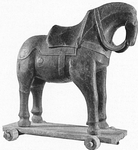
Reitpferdchen für Kinder, Holz bemalt, 17. Jahrhundert Engadiner Museum St. Moritz

Pierre Bonnard ist ein Poet des Lichtes und der Farben. Keiner hat wie dieser schönheitstrunkene Maler die Reize des über Körper, Dinge und Landschaften fließenden Lichtes darzustellen gewußt. Mit seinem malerischen Werk hat er die beste Tradition des französischen Impressionismus zu neuer und genial persönlicher Vollendung geführt. Zu Recht gilt Pierre Bonnard als einer der größten Meister der modernen Malerei. Im Jahre 1947 ist der achtzigjährige Maler in Le Cannet am Ufer seines geliebten Mittelmeeres gestorben. – Die Basler Kunsthalle widmet ihm vom 28. Mai bis zum 17. Juli 1955 eine bedeutende Ausstellung. Sie umfaßt rund neunzig ausgesuchte Gemälde sowie Aquarelle, Zeichnungen und Graphik aus zahlreichen Museen und Privatsammlungen von Frankreich, Belgien, Holland, England, Italien und der Schweiz. Gerade in unserem Lande hat der große Kolorist immer besondere Freunde und Sammler gefunden. rst.