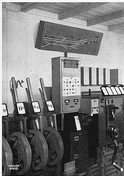
Stationsausrüstung für einen automatischen Block mit fernbedienter Blockstelle, angebaut an ein mechanisches Stellwerk. Rechts die Hebelsperren und in der Mitte der Bedienungsapparat.

vertraut vorbehaltlos auf die Betriebssicherheit der schweizerischen Eisenbahnen. Und dies mit vollem Recht, denn die Eisenbahntechnik ist heute so hochentwickelt, daß auch menschliche Unzulänglichkeiten weitgehend ausgeschaltet werden können.